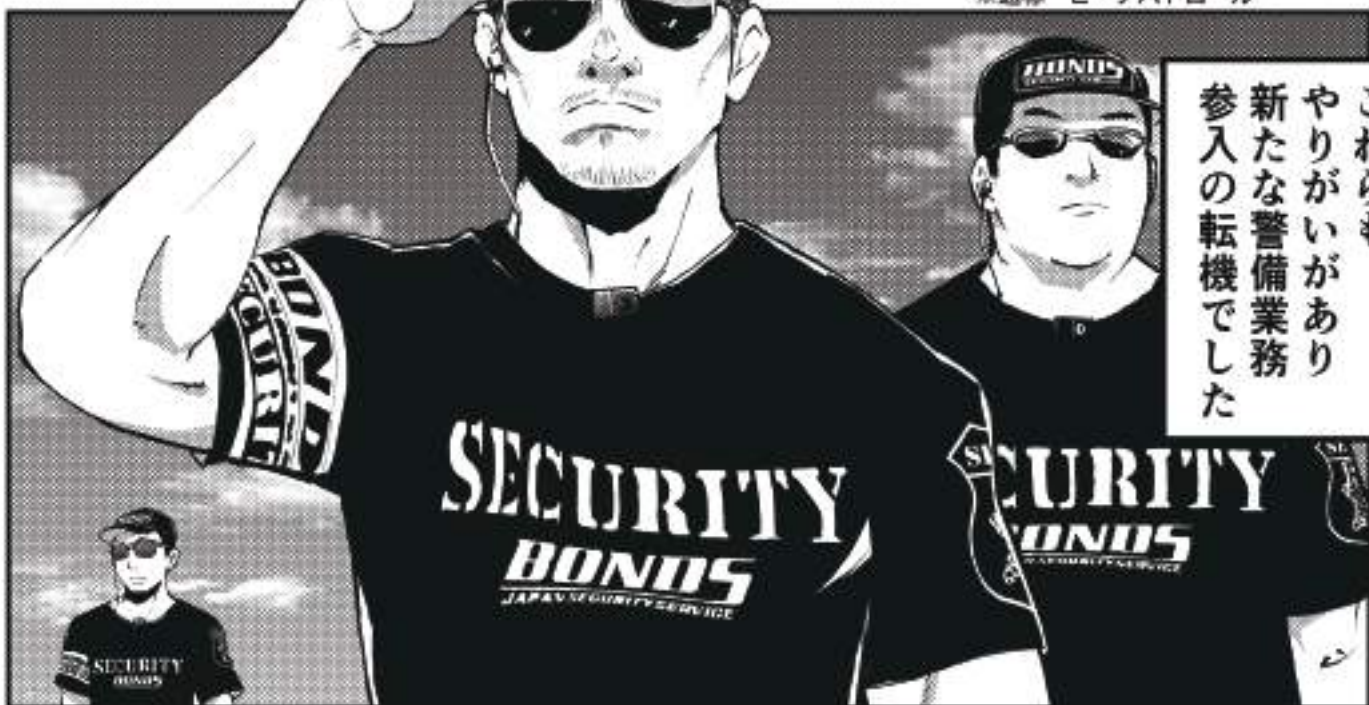
※通称 ビーチパトロール

当初頂いた警備内容は 「海岸における 迷惑行為その他 トラブル全般の 防犯による巡回警備」 でした